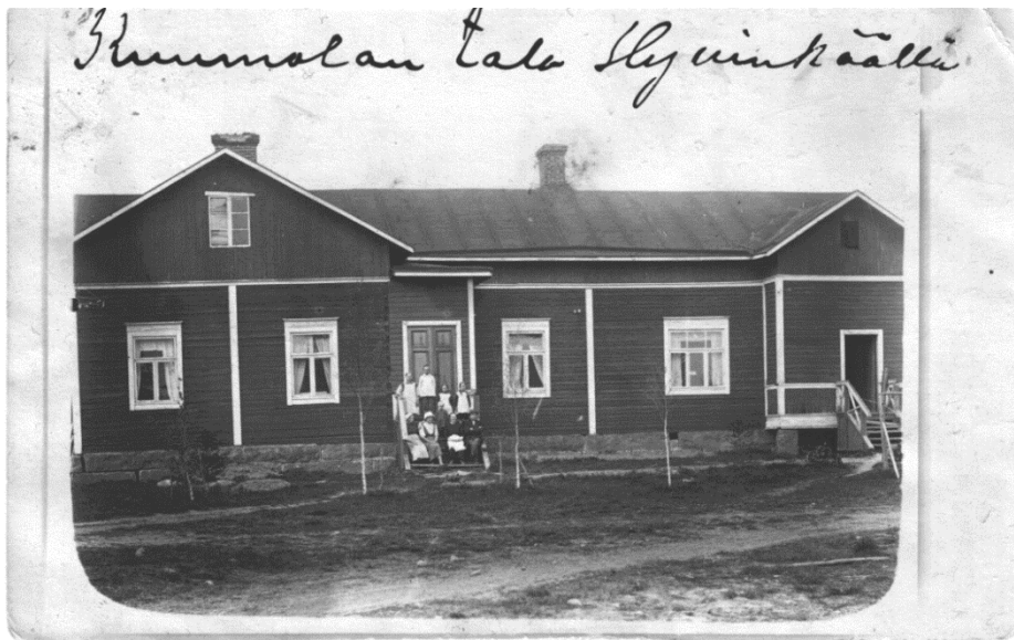
Kuumolan talo tapahtuman aikoihin